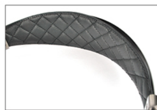
· 頭帶採用印上菱格紋的環保皮革，質感柔軟。