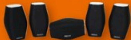
迷你靚聲環繞組合 Monitor Audio MASS 5.1

isf THX 專業認證鑑定 3D · CAS · HEADPHONE 全方位影音誌