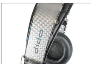
· 機身以雷射雕刻出各種紋理、品牌標誌及型號字樣。