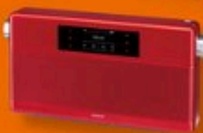
回歸收音機狂熱 Geneva WorldRadio